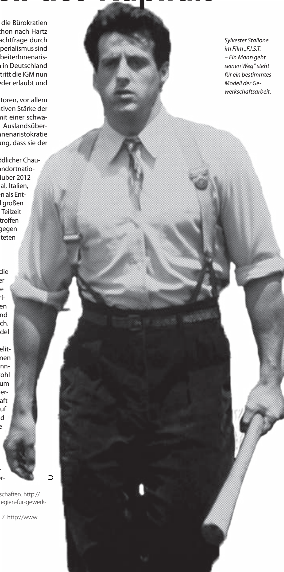
Sylvester Stallone im Film „F.I.S.T.“ – Ein Mann geht seinen Weg“ steht für ein bestimmtes Modell der Ge- werkschaftsarbeit.

Im Organisierungsbereich der großen Industriegewerkschaften steht insgesamt weder für die Gewerkschaftsbürokratie noch für das Kapital ein Ende der Kollaboration zur Debatte, auch wenn dafür Teile der eigenen Basis geopfert werden müssen. Die letzte Probe für den Kadaver-