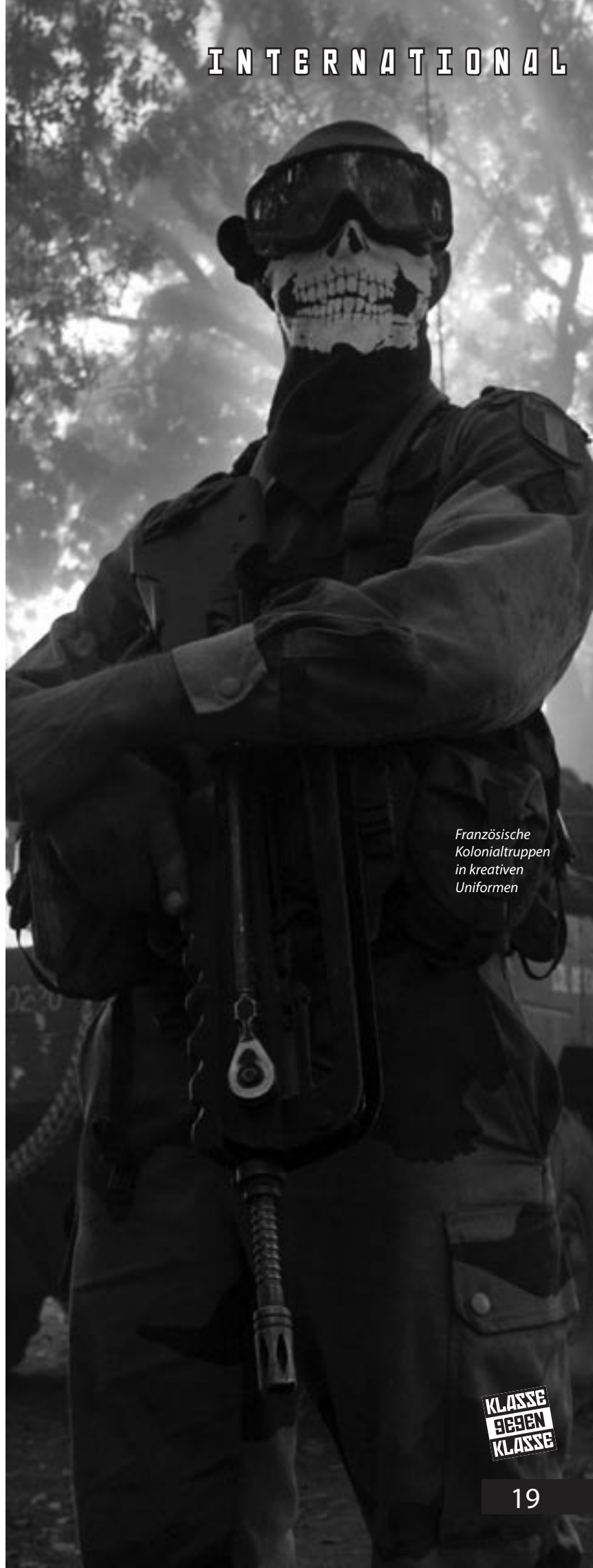
Französische Kolonialtruppen in kreativen Uniformen

Auf der anderen Seite formierte sich die „Einheitsfront zur Rettung der Demokratie“ (FDR), in der die rechten Parteien der