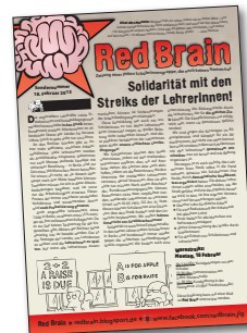
Red Brain linke SchülerInnenzeitung von einer unabhängigen SchülerInnenengruppe redbrain.blogspot.de