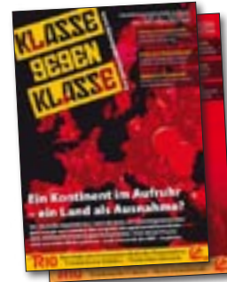
Nr. 3. Ein Kontinent im Aufruhr – ein Land als Ausnahme? Schwerpunkt: Trotzki's Marxismus – Taktik und Strategie 32 Seiten – 2 €