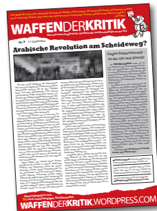
WAFFENDERKRITIK regelmäßiges Flugblatt an der Uni von RIO und unabhängigen Studierenden waffenderkritik.wordpress.com