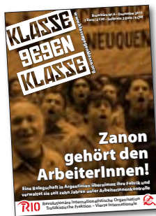
Zanon gehört den ArbeiterInnen! Eine Belegschaft in Argentinien übernimmt ihre Fabrik und verwaltet sie selbst 20 Seiten – 1 €

ABOS: Unterstütze Klasse Gegen Klasse mit einem Abo! So bekommst du alle zwei bis drei Monate die neuste Ausgabe per Post – und wir bekommen regelmäßige Einnahmen für unsere politische Arbeit, die sich nicht auf diese Zeitschrift beschränkt.