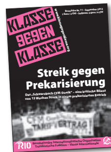
Streik gegen Prekariisierung Das „Schwarzbuch CFM-Streik“ – eine kritische Bilanz von 13 Wochen Streik 36 Seiten – 2 €