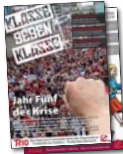
Nr. 5. Jahr Fünf der Krise – wie sieht eine revolutionäre Alternative aus? Schwerpunkt: Für einen europäischen Generalstreik! 32 Seiten – 2 €

Mit dieser Zeitschrift wollen wir die wichtigsten Lehren aus der Geschichte und aus dem internationalen Klassenkampf aufarbeiten. Auf der Grundlage eines Programms, das diese Lehren aufhebt, wollen wir uns mit den fortschrittlichsten Sektoren der ArbeiterInnenklasse und der Jugend fusionieren und damit zum Aufbau einer großen revolutionären ArbeiterInnenpartei beitragen, als Teil einer Weltpartei der sozialistischen Revolution, der Vierten Internationale.