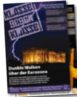
Nr. 4. Dunkle Wolken über der Eurozone Schwerpunkt: Kampf der Kumpel im Spanischen Staat 32 Seiten – 2 €